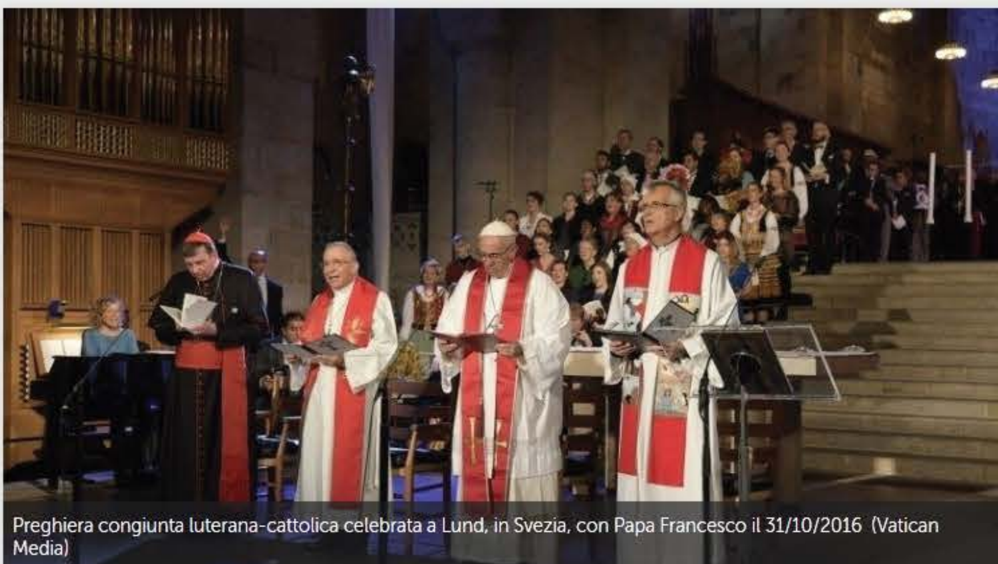
Preghiera congiunta luterana-cattolica celebrata a Lund, in Svezia, con Papa Francesco il 31/10/2016

CHIESA PAPA FRANCESCO ECUMENISMO TWEET CRISTIANI